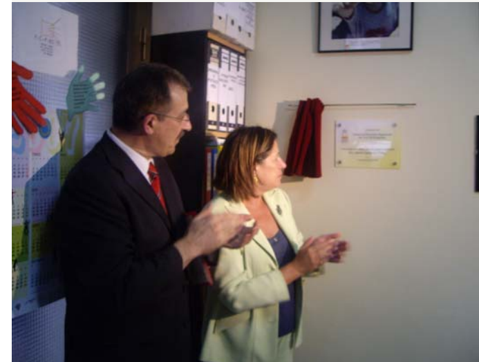
Moment en que Carme Capdevila i Palau (Consellera d'Acció Social i Ciutadania) inaugura el Centre de Recursos Apsocecat per la Sordceguesa

El passat 17 de Setembre de 2007, la Consellera d'Acció Social i Ciutadania de la Generalitat de Catalunya, Carme Capdevila i Palau, va inaugurar el Centre de Recursos per la Sordceguesa a "Can Joanot"; nom que rep el local on s'emplaça APSOCECAT; Entitat que porta des de