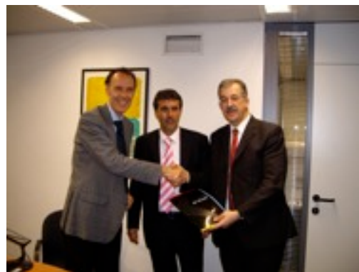
Moment en que es firmava l'acord entre els membres de "la Caixa" i el president d'Apsocecat

A finals del mes de maig "la Caixa" va concedir una subvenció a Apsocecat, que finançarà projectes per donar resposta a les necessitats de persones adultes amb sordceguesa. L'ajuda econòmica serà destinada a persones sordcegues usuàries de centres de dia o tallers ocupacionals.