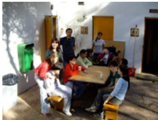
Foto de grup abans de començar a berenar