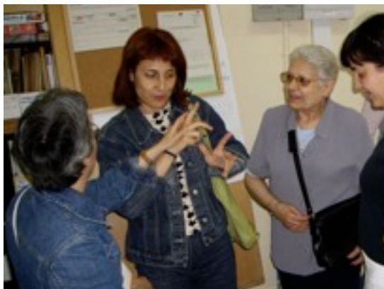
Membres d'una de les noves famílies afiliades a l'associació