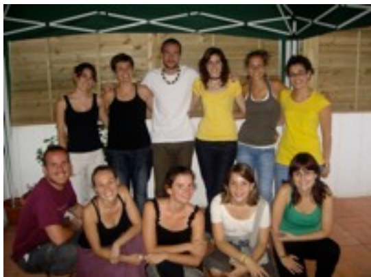
Participants a un curs de formació per a mediadors en sordceguesa

Palamós es convertirà properament en la destinació de vacances de molts nens i nenes amb sordceguesa. Això és degut a que Apsocecat ha organitzat colònies d'estiu per a nens i nenes amb aquesta problemàtica.