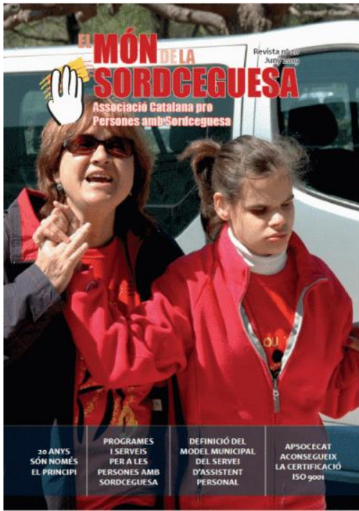
Portada de la revista número 18 de "El món de la sordceguesa"

Es fa una edició anual de la revista "El món de la sordceguesa" . El nº 20 es va publicar el mes de juny. Disponible en paper, i en pdf a www.apsocecat.org